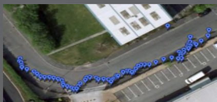
Обработка данных Google Earth™